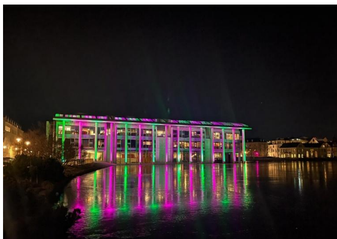
Winter Lights Festival(Feb 5-8)