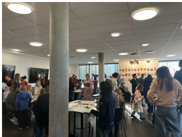
日本語学科主催の Japan festival