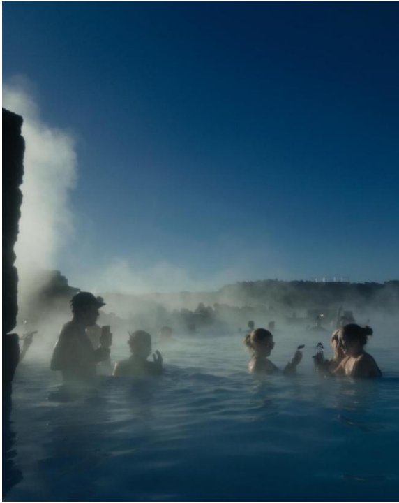
左) ブルーラグーン