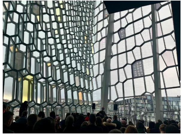
右) 東南アジア音楽イベント