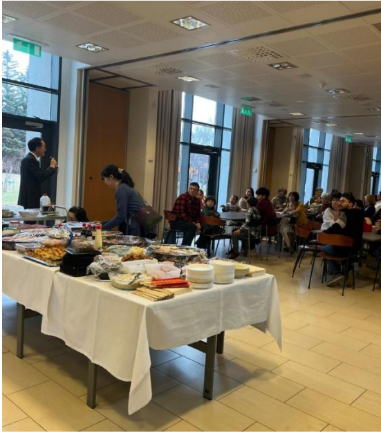
大使館主催の在アイスランド日本人会