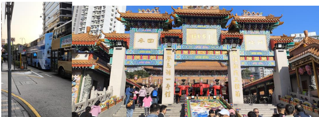
(左) 香港・尖沙咀を走る二段バス (右) 啬色園黄大仙祠