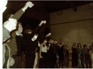
合唱団の合宿の様子(新入生歓迎会やディナーパーティーも)