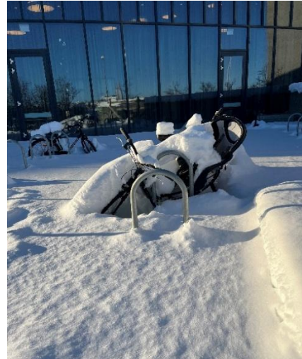
1 日中大雪だった日の様子(この日以降は降っていません)