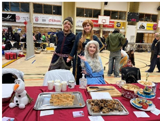
地域の国際イベントで日本ブースを出展