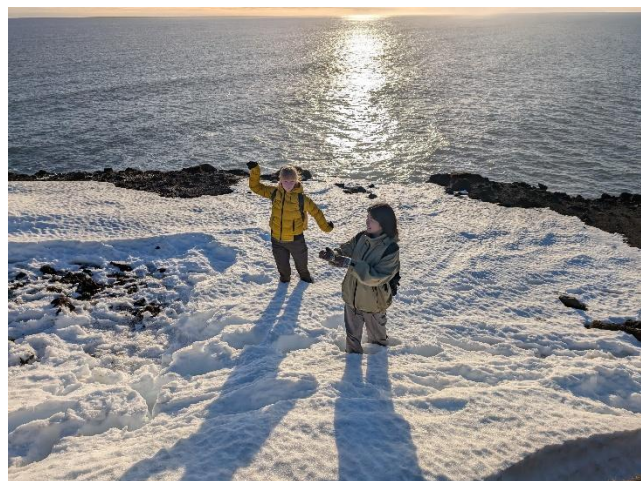
Reykjanes 周辺でのハイキング

聞きたいこと，知りたいこと，なにかあれば気軽にこちらまで:) n25m824@matsu.shimane-u.ac.jp