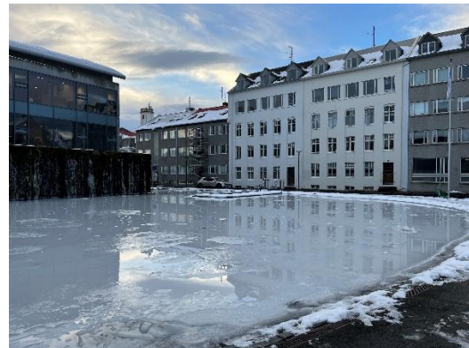
凍った湖の様子(湖面に反射した景色は絵画のようでとても綺麗でした)