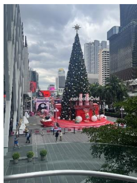
ショッピングモール