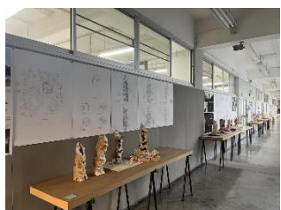
廊下に飾られている学生作品の模型