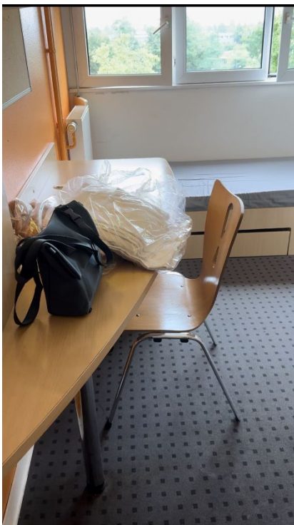
学生寮の部屋の中で部屋はそれほど広くないですがトイレとシャワールーム、冷蔵庫がありキッチンは共用になります。