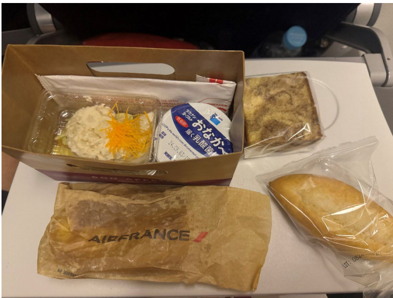
機内で出された一回目の食事