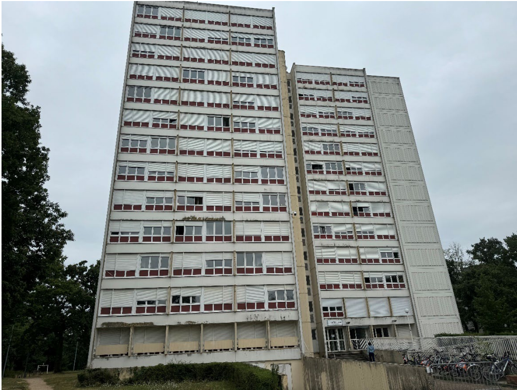
留学生が多く住む学生寮で学校からは徒歩 10 分