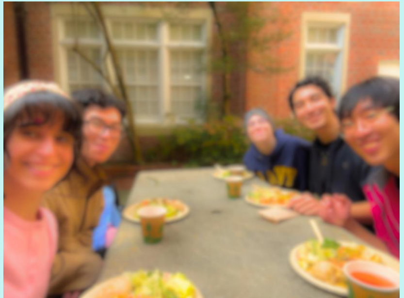
Reitz Union! ⇒