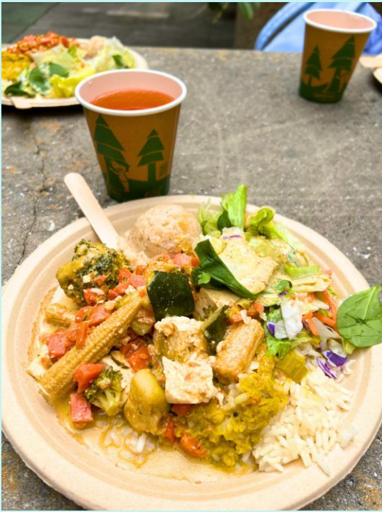
↑ Krishna Lunch $6 ほどで食べられます！