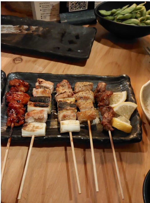
*この写真はトロントの Zakkushi という居酒屋で食べた焼き鳥です。

11月には ThanksGiving という祝日があり、ケント州立大学は水曜日から日曜日まで休みでした。この休みを利用してカナダのトロントに行きました。トロントは初めてでしたが、日本のお店が多いのでとても楽しめました。この旅行ではひたすら普段ケントでは食べることができない美味しい日本食を食べることに専念しました。トロントの街は日本人も多く非常に住みやすそうだと感じました。また機会があれば再訪したいと思います。ケント州立大学では今回の ThanksGiving のような連休が秋学期中に2回あります。いずれも4日以上あるため旅行に行く人が多いです。今回は友達に車で連れて行ってもらいましたが、一ヶ月前だと交通機関のチケットの値段も安く購入できるため、早くから予定を立てておくことをオススメします。