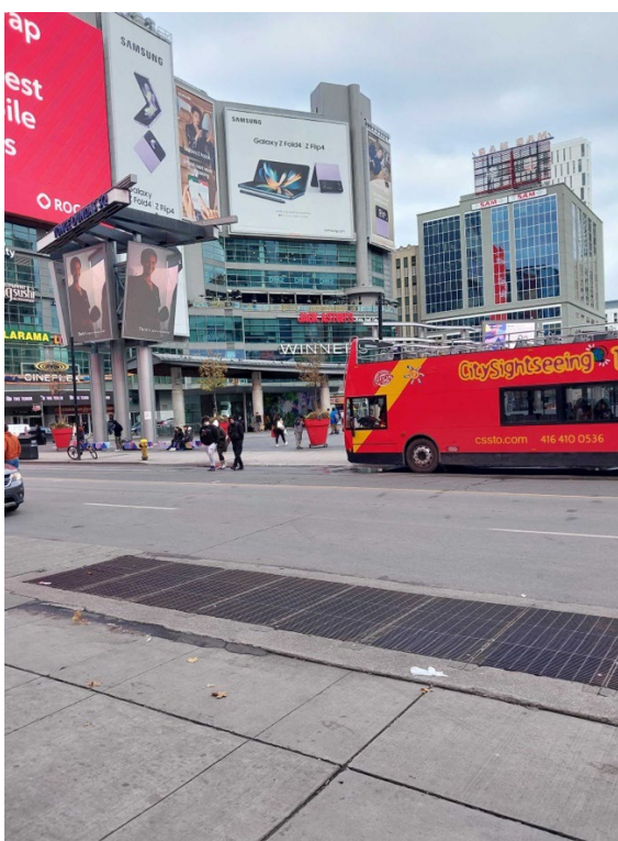
*この写真はトロントの街です